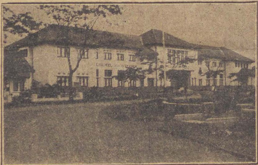
De Kweekschool v. h. Leger des Heils te Bandoeng.

Er was een groote, geestelijke honger merkbaar in deze samenkomst, en toen de Kommandant de uitnodiging gaf, kwamen er spoedig een 30-tal makkers bij de heilijngstafel neerknielen om God te zoeken.