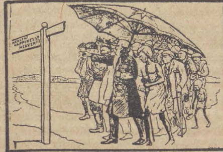
Alle naties vereenigd onder de parapluie van het Leger des Heils.

Zondagmorgen sprak Mevrouw de Groot over de zegeningen die God Zijn volk bereidt.