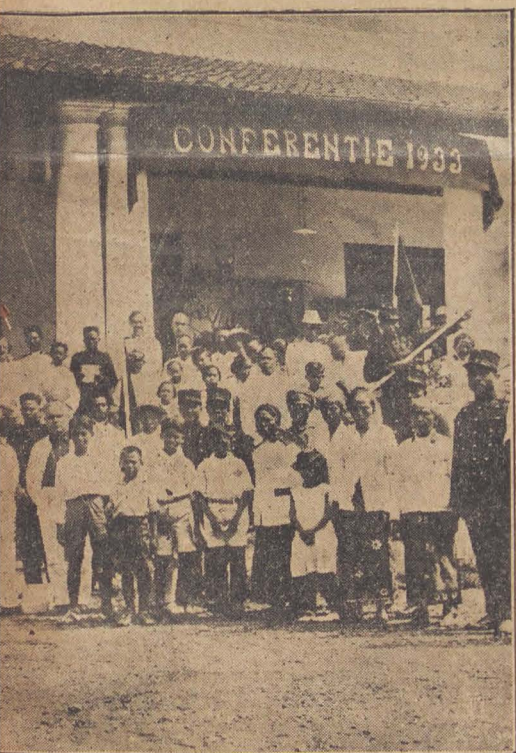
aan de Conferentie te Magelang.

t des Heil'gen Geestes, hart begint, weerstand biedend, ruste vindt: