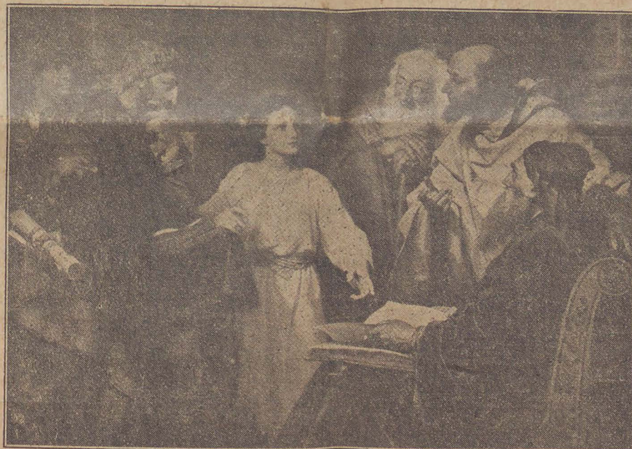
Jezus met de Schriftgeleerden in den Tempel.

Er waren in de eerste eeuwen na Christus, heiligen die zich volkomen van de wereld afzonderden en elke aanraking met de menschen