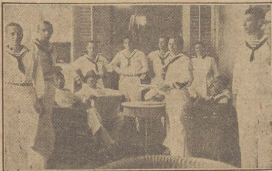
Militair Tehuis Soerabaja.

Allen, goed gelegen, gezellig ingericht, goed verzorgd, en in den geest van Christus geleid, zijn een welkom en prettig onderd voor de degenen, die geen familie of kennissen in Indië hebben waar zij in huiselijken kring kunnen vertoeven en dus niet weten waarheen.