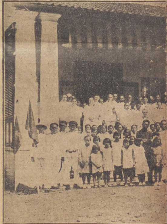
Officiëren en makkers die deelnamen